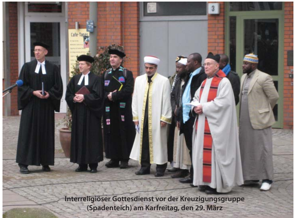
Interreligiöser Gottesdienst vor der Kreuzigungsgruppe (Spadenteich) am Karfreitag, den 29. März

18.30: Gemeinsame Verantwortung, gemeinsames Beten - Christlich-islamischer Gottesdienst;