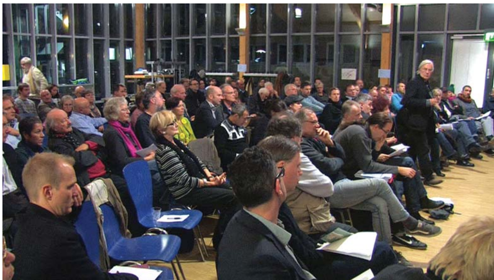
Soll 2013 auslaufen: Stadtteilbeirat St. Georg

Dies ist die Überschrift des ersten Hamburger Stadtteilbeiräte-Kongresses, der am 27. April stattfinden wird. Es handelt sich aber auch um ein Motto, das für den St. Georger Stadtteilbeirat in den kommenden Monaten noch an Gewicht gewinnen dürfte. Zum zweiten Mal droht nämlich, dass diese einzige Beteiligungsstruktur von unten, also aus dem Stadtteil heraus, selbst in seiner bescheidenen Form beschnitten, wenn nicht gar aufgelöst werden soll. Bis zu 100 Menschen kommen hier allmonatlich zusammen, um sich über neueste Entwicklungen zu informieren, Sorgen vor- und Anträge einzubringen und damit die so wichtige Stadteildiskussion zu führen.