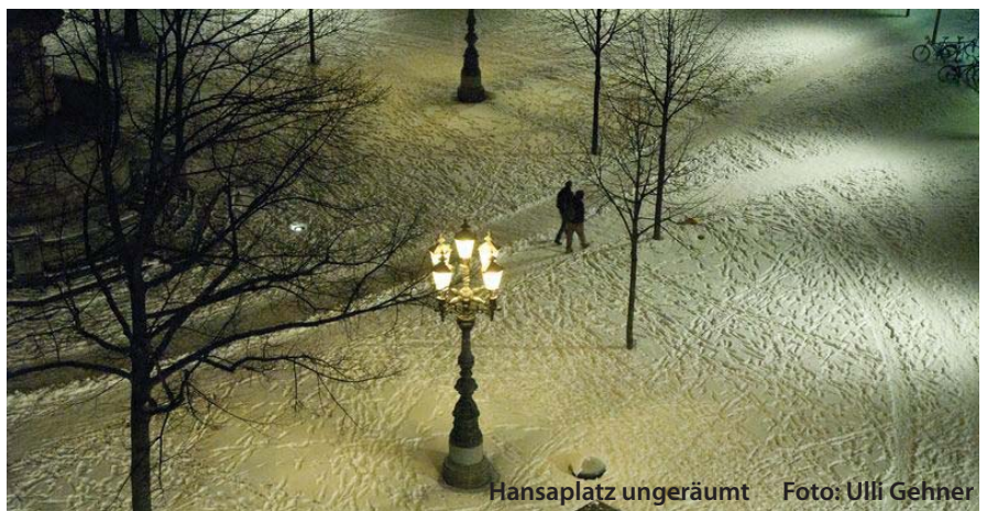
Hansaplatz ungeräumt

Dass private HauseigentümerInnen auch in diesem langen Winter oftmals ihren Räumpflichten nicht nachgekommen sind, ist das eine (was auch mal Konsequenzen haben müsste). Dass aber die Stadt(reinigung) es nicht für nötig befindet, öffentliche Flächen von Eis und Schnee zu befreien, ist das andere. Über Wochen lag der Schnee auf dem Hansaplatz knöchelhoch, für alle PassantInnen - insbesondere die SeniorInnen - der Anlass, den Platz bestenfalls zu umrunden. Die „Schuldenbremse“ des Senats (also die Beschränkung bzw. Reduzierung öffentlicher Aus- für öffentliche Aufgaben) lässt uns also ungebremst ausgleiten. ■