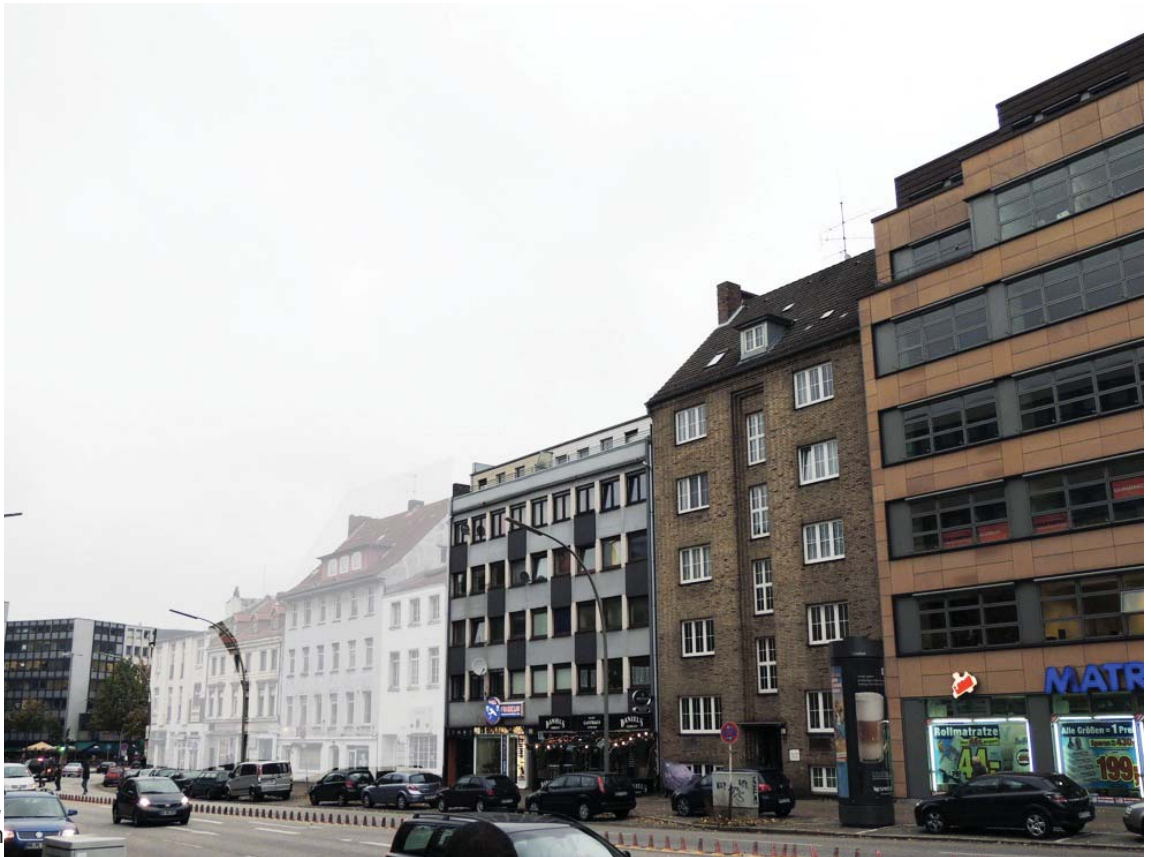
Die vier inzwischen abgerissenen Häuser im Foto oben kaschiert dargestellt.

Folge hätte. Die Lösung wäre, dass die bereits bestehende Tiefgarage, von der keine Lärmbelastung ausgeht, ausgebaut wird. Das bedeutete für den Bauherren aber Mehraufwand. Vor dem Stadtteilbeirat konnte das „Argument“ der Architekten, ein schützenswerter Baum lasse die lärmindernde Erweiterung der bestehenden Tiefgarage nicht zu, anschaulich widerlegt werden: Der Baum steht nämlich deutlich entfernt vom „Tatort“.